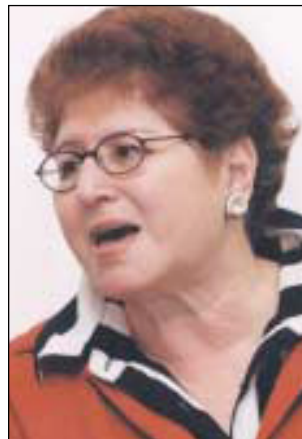
רוניק. אברג'יל מטריד אותי באופן סדרתי

לדבריו הוא מסר למרדור נפגעי עבירות במשטרת ישראל יומנים ותדפיסי טלפון של אישיתו וביקש שיחקרו את ילדיו אבל שם העדיפו לסגור את התיק בחוסר ראיות במקום לחקור את הנושא.